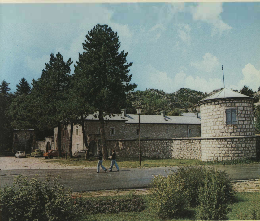
▲ Цетинје — Биљарда (1838) Cetinje Biljarda (1838) Cetinje — the Biljarda palace (1838) Cetinje — La Biljarda (1838) Cetinje — die »Biljarda« (1838) Cettigne: Il palazzo »Biljarda« (1838) Цетине — здание Билярда (1838 г.)