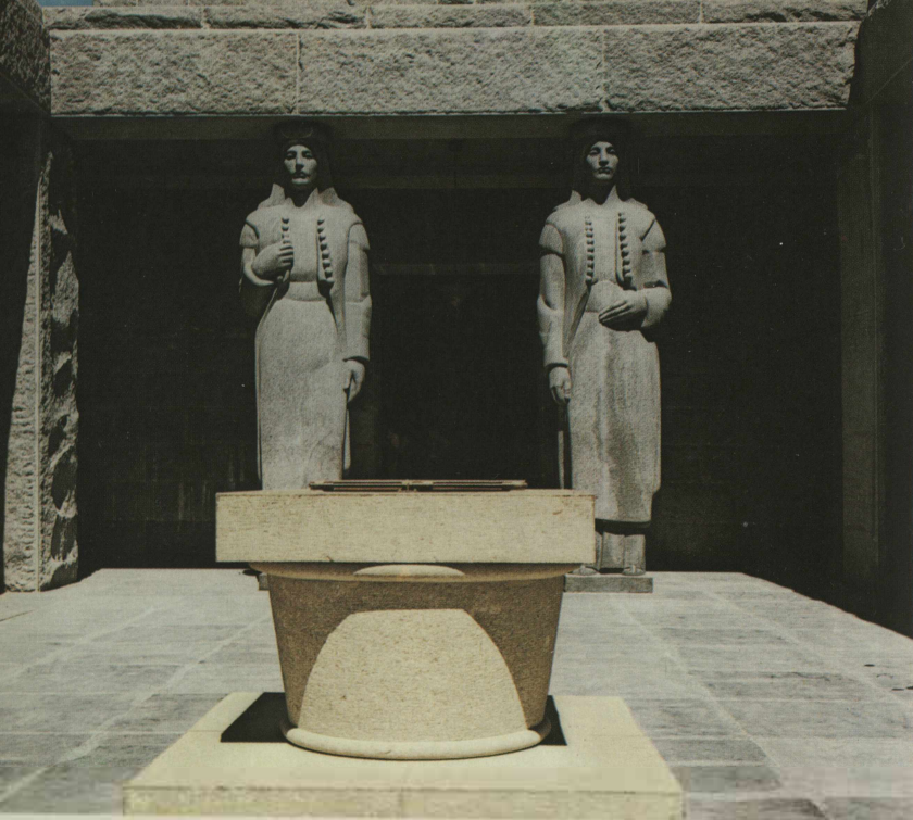
▲ Атријум Маузолеја Atrijum Mauzoleja Mausoleum atrium L'atrium du Mausolée Atrium des Mausoleums L'atrio del Mausoleo Атриум в составе Маузолея