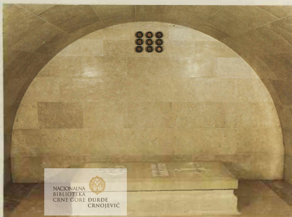
Крипта са гробницом Kripta sa grobnicom Crypt with tomb La crypte et le tombeau Kripta mit Sarkophag La cripta e la tomba Крипта с саркофагом ▶