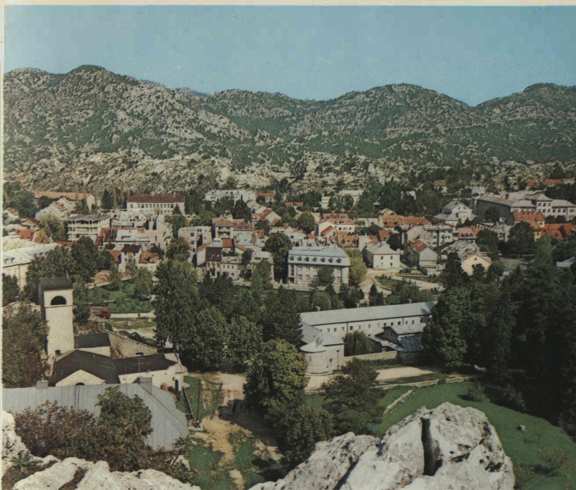
▲ Панорама Цетиња Panorama Cetinje A view of Cetinje Panorama de Cetinje Blick auf Cetinje Panorama di Cettigne Панорама Цетине