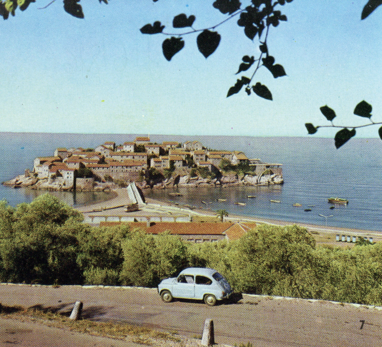
7 Grad-hotel Sveti Stefan St. Stephan — the hotel city Hotel-Stadt St. Stephan La ville-hôtel Saint Stephan