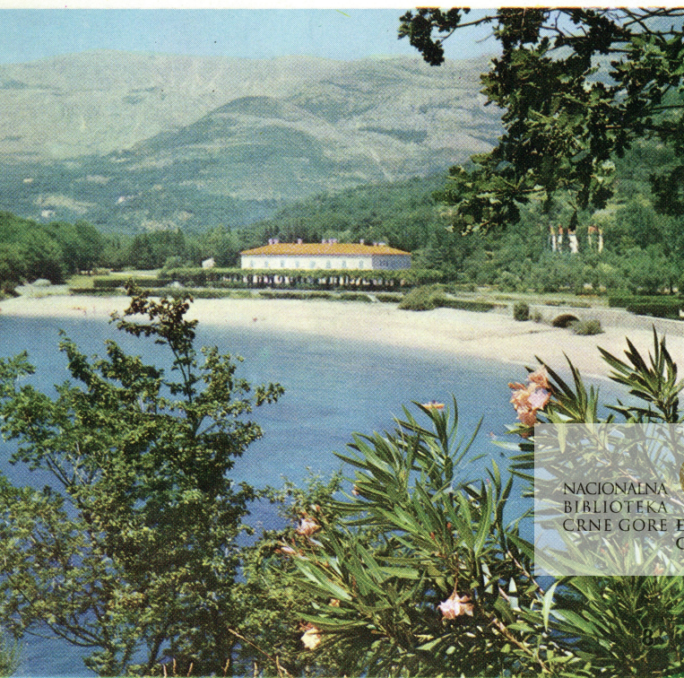
8 Hotel »Miločer«